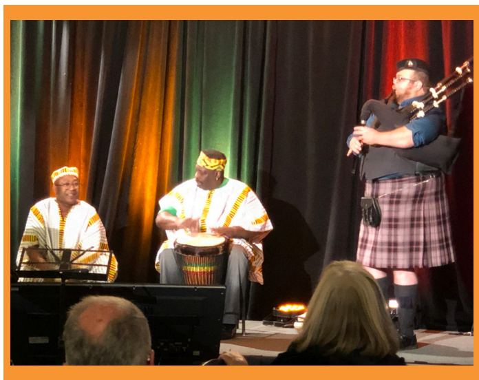
Le gala a été animé par des musiciens représentant des groupes culturels locaux.